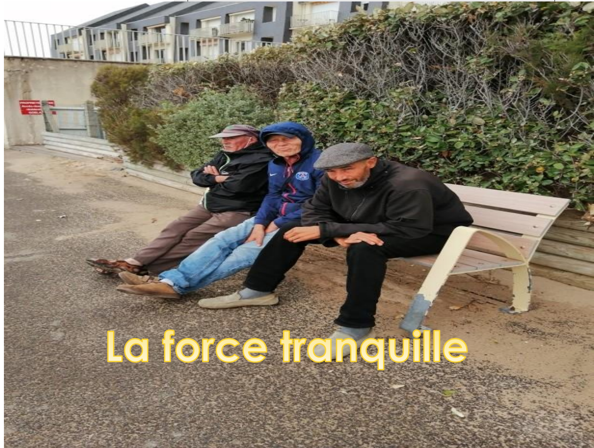
La force tranquille